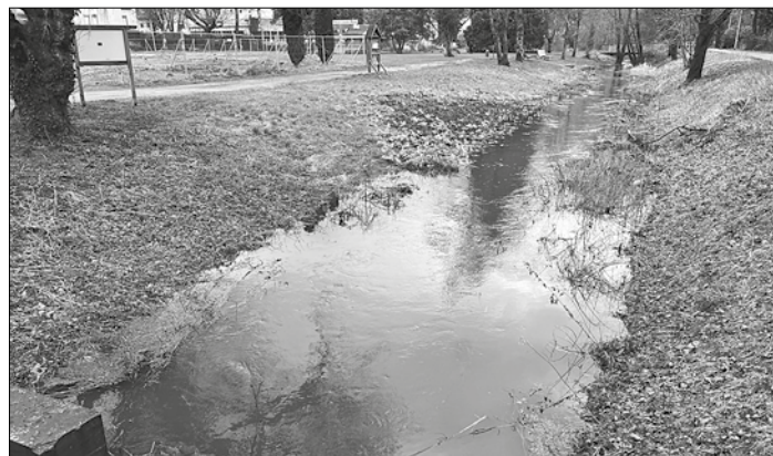
Die Wassermassen des Dauerregens, wie hier im Rohrbach, liefen stadtwweit ungehindert ab.

Nach dem anhaltenden Dauerregen der letzten Tage und steigenden Pegeln im Saarland bleibt die Hochwasserlage in St. Ingbert entspannt. Derzeit rechnet die Stadtverwaltung mit keiner Hochwasserproblematik am Rohrbach und Würzbach. Zudem kommt es am Wochenende zu einer Wetteränderung. Weder am Rohrbach in St. Ingbert noch am Pegel des Würzbachs in Oberwürzbach wurde die Meldestufe 1 erreicht. Die Abflussmengen bewegten sich konstant unter der Meldestufe 1 von 2. In allen Bereichen floss das Wasser ungehindert ab. Präventiv waren Mitarbeiter der Stadtverwaltung und Führungskräfte der Feuerwehr in Oberwürzbach unterwegs, um den Wasserabfluss vom Römerweg zum Bereich Dörrenbach und Steckental zu kontrollieren. Im Bereich Am Fuhrweg/Dörrenbach wirkten die Maßnahmen, die die Hausbesitzer und die Stadt getroffen hatten. Es kam zu keinen Wassereintrüben. Im Steckental verhinderte die Feuerwehr einen Wassereintruch in ein Haus und eine Garage. An einigen Stellen im Stadtgebiet reinigte der städtische Betriebshof Regeneinläufe, um ein Abfließen des Wassers zu fördern.