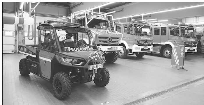
Neue Einsatzfahrzeuge für die Feuerwehr: vlnr. UTV, TLF-W, HLF 10 und HLF 20.

ALLES AUS EINER HAND! MIT QUALITÄT & SERVICE! WIR MODERNISIEREN BAD U. HEIZUNG ZUM FESTPREIS! Besuchen Sie unsere große Bäder- u. Heizungsausstellung