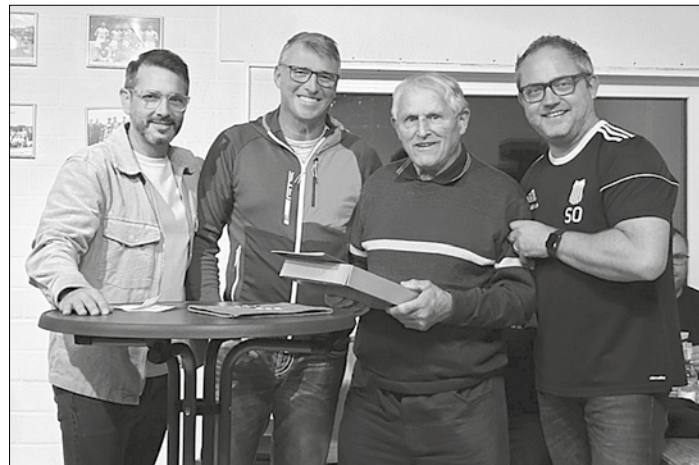
Bericht und Fotos: Marco Peters

Im Anschluss an die Neuwahlen, fand die Ehrung von langjährigen Mitgliedern des Vereins statt. Insgesamt 17 Mitglieder, wurden für ihre 25-, 40-, 50-, 60- oder 70-jährige Mitgliedschaft im Verein geehrt.