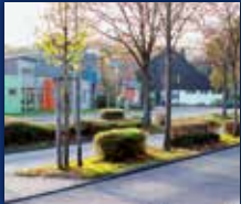
DORF IM WARNDT

35. JAHRGANG • NR. 48/2023 • FREITAG, DEN 01.12.2023