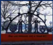
DORF IM WARNDT

34. JAHRGANG • NR. 48/2022 • FREITAG, DEN 02.12.2022