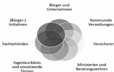
Abbildung: Starkregen- und Hochwasser-Risikomanagement als Gemeinschaftsaufgabe.

Hochwasser- und Starkregenvorsorge ist eine Gemeinschaftsaufgabe und kann nur durch die erfolgreiche Zusammenarbeit gelingen!