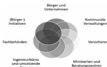
Abbildung: Starkregen- und Hochwasser-Risikomanagement als Gemeinschaftsaufgabe.

Hochwasser- und Starkregenvorsorge ist eine Gemeinschaftsaufgabe und kann nur durch die erfolgreiche Zusammenarbeit gelingen!