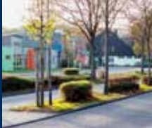
DORF IM WARNDT

34. JAHRGANG • NR. 40/2022 • FREITAG, DEN 07.10.2022