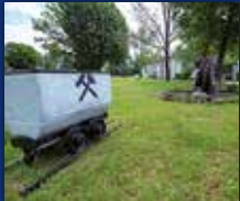
DORF IM WARNDT

35. JAHRGANG • NR. 38/2023 • FREITAG, DEN 22.09.2023