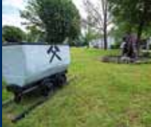
DORF IM WARNDT

34. JAHRGANG • NR. 38/2022 • FREITAG, DEN 23.09.2022