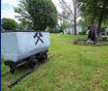
DORF IM WARNDT

34. JAHRGANG • NR. 37/2022 • FREITAG, DEN 16.09.2022