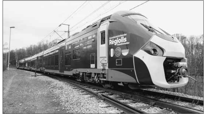
Foto: Coradia Polyvalent

Das vollständige Programm zu beiden Tagen finden Sie unter www.saarvv.de/tag-der-schiene .