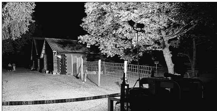
An der Örtlichkeit wurde ein umfangreiches Spurenbild festgestellt,

Am Samstag, dem 26.8.2023, wurden um 20:49 h die Löschbezirke West und Süd zur Amtshilfe in den Wildpark nach Karlsbrunn gerufen. In Höhe des Futterhauses kam es nach derzeitigen Erkenntnissen zu einem Gewaltdelikt mit mehreren Beteiligten. Zwei Personen wurden hierbei erheblich verletzt.