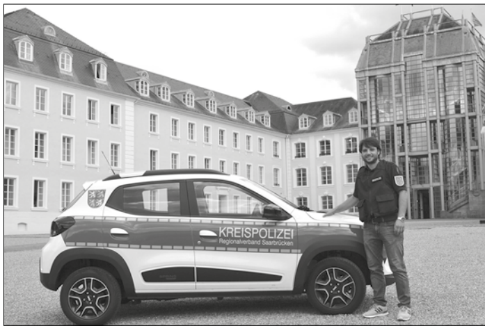
Die Mitarbeitenden der Waffenbehörde des Regionalverbandes kommen mit dem neuen Dienst-E-Wagen zu den Vor-Ort-Kontrollen.

Weitere Informationen stehen online unter www.regionalverband.de/waffen