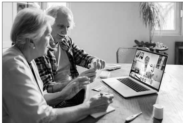
Die Zukunft der medizinischen Versorgung: Die digitale Sprechstunde

Auch, wenn das vielleicht noch nach Zukunftsmusik klingt: Pilotprojekte wie der Tele-Notarzt zeigen, dass die Entwicklung hin zur digitalen Gesundheitsversorgung bereits in vollem Gange ist.