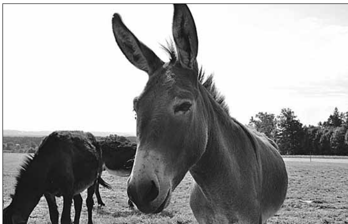
Ein Waldspaziergang der besonderen Art: Esel und eine kleine