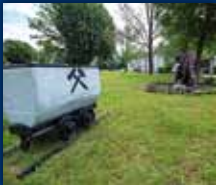
DORF IM WARNDT

34. JAHRGANG • NR. 34/2022 • FREITAG, DEN 26.08.2022