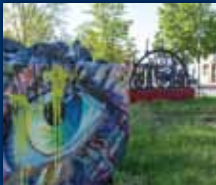
DORF IM WARNDT

34. JAHRGANG • NR. 25/2022 • FREITAG, DEN 24.06.2022