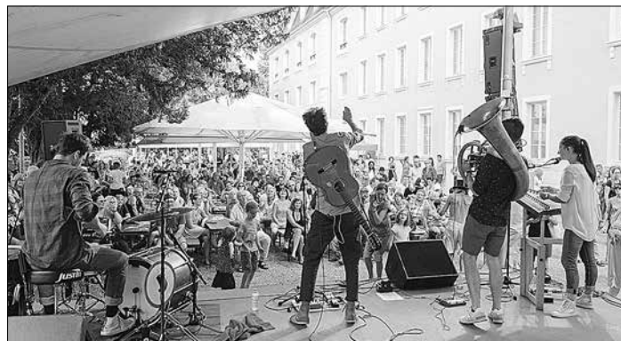
Impala-Ray by Rich Serra

Vorstellungen sowie die Führungen mit dem Schlossgespenst. Das vollständige Programm gibt es gedruckt in zahlreichen Kultur- und Tourist-Infos und den Filialen der Sparkasse sowie online unter www.regionalverband.de .