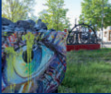
DORF IM WARNDT

34. JAHRGANG • NR. 21/2022 • FREITAG, DEN 27.05.2022