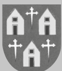
Dorf im Warndt

Siehe unter den einzelnen Gemeindebezirken im Gemeindejournal