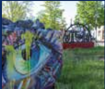
DORF IM WARNDT

35. JAHRGANG • NR. 20/2023 • FREITAG, DEN 19.05.2023