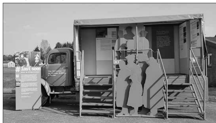
Foto: Der LKW in der Gedenkstätte Lager Sandbostel Mehr Informationen Pressefotos zu dem Projekt unter:

Das Ausstellungsprojekt startete am 20. Januar 2022 in München und machte bereits in mehreren -Städten in Deutschland Station. #LastSeen entstand in Zusammenarbeit mit der Gedenk- und Bildungsstätte Haus der Wannsee-Konferenz, dem Zentrum für Antisemitismusforschung TU Berlin, dem Institut für Stadtgeschichte und Erinnerungskultur im Kulturreferat der Landeshauptstadt München sowie dem USC Dornsife Center for Advanced Genocide Research an der University of Southern California. Die Finanzierung übernahm die Stiftung Erinnerung, Verantwortung, Zukunft.