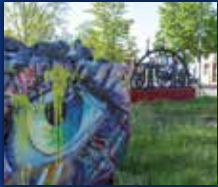
DORF IM WARNDT

35. JAHRGANG • NR. 18/2023 • FREITAG, DEN 05.05.2023