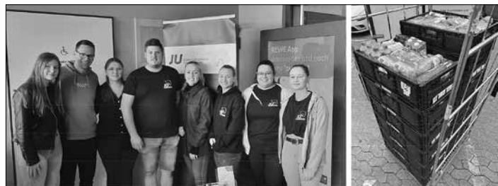
Mitglieder der JU Großrosseln und ein Teil der Sachspenden

Die Junge Union bedankt sich bei allen Spenderinnen und Spendern, dem REWE Götz Großrosseln sowie der Saarbrücker Tafel für die tolle Unterstützung.