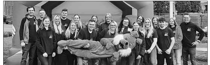
Mitglieder der Jungen Union gemeinsam mit dem Osterhasen

Die JU Großrosseln bedankt sich bei allen Gästen und freut sich jetzt schon auf das Osterfamilienfest 2024!