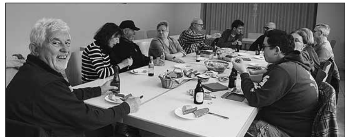
Spaß und Unterhaltung beim anschließenden Umtrunk