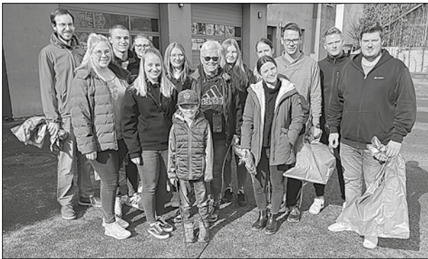
Mitglieder der JU Großrosseln