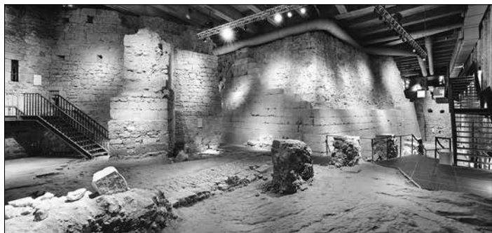
Blick in die Unterirdische Burg

Das Historische Museum Saar ist das einzige deutsche Landesmuseum, das nicht nur die Landesgeschichte, sondern auch die Geschichte der deutsch-französischen Grenzregion in den Fokus seiner Dauerausstellung stellt. Auch durch seine Lage nahe der Grenze zu Frankreich am geschichtsträchtigen Saarbrücker Schlossplatz ist das Museum einzigartig. Nur in wenigen Museen ist die Dauerausstellung so intensiv und vielfältig mit den originalen historischen Orten und Schauplätzen verbunden. Dadurch haben die Besucherinnen und Besucher den Eindruck, 800 Jahre Geschichte vor Ort hautnah zu erleben.