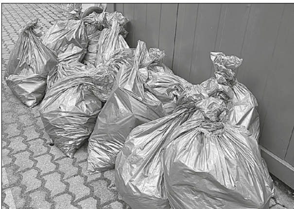
„Müll-Ergebnis“ nach der Aktion

Während ihren Touren durch die Gemeinde sammelten die Helferinnen und Helfer Unmengen an Müll, der in der Umwelt entsorgt wurde. Darunter waren auch teils kuriose Dinge wie Zahnbürsten, Babywindeln, Kleider, Abwasserrohre und und und, die nichts in der Natur zu suchen haben.