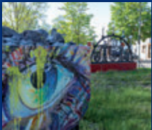
DORF IM WARNDT

34. JAHRGANG • NR. 12/2022 • FREITAG, DEN 25.03.2022