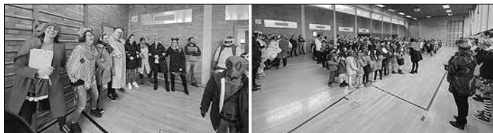
Doll Doll, Allee Hopp und Allee Hopp Miau Ihr Kollegium der Wilhelm Heinrich Grundschule