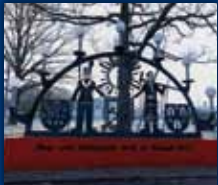
DORF IM WARNDT

34. JAHRGANG • NR. 09/2022 • FREITAG, DEN 04.03.2022