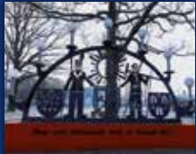
DORF IM WARNDT

36. JAHRGANG · NR. 07/2024 · FREITAG, DEN 16.02.2024