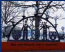
DORF IM WARNDT

36. JAHRGANG • NR. 03/2024 • FREITAG, DEN 19.01.2024