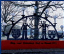
DORF IM WARNDT